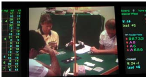
Bridžoráma na ME

V 8. kole se v bridžoramě právem objevil zápas dvou předních celků aktuálního pořadí Open, České republiky a Nizozemska, které se v té době dělily o 5. místo. V komentářích expertů a novinářů bylo oceňováno jak umístění, tak pozitivní vývoj, kterým český bridž v posledních letech prošel. Do zápasu nastupovali jako favorité naši soupeři, nejen pro svá minulá umístění na ME, ale i proto, že v minulém zápase právě porazili vedoucí Itálii na IMP 30:28.