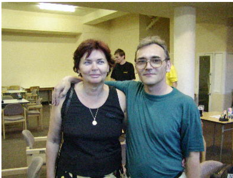
Vítězové hlavního párového turnaje

Hlavního turnaje týmů se účastnilo 10 týmů z pěti zemí. Kvalifikace určila pořadí finálových bojů o první a třetí místo.