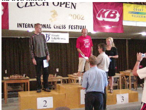
Celková vítězové Czech Open