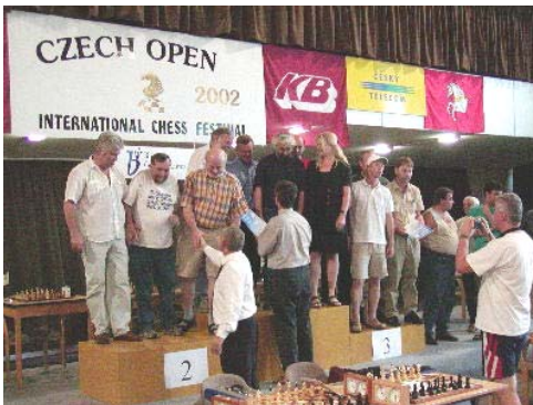
Vítězové hlavního turnaje týmů