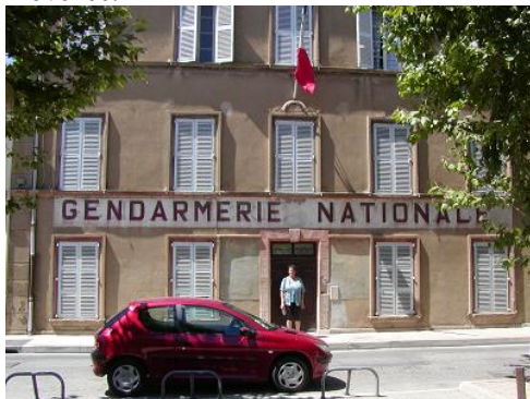
Četnická stanice v Saint Tropez

Po šesti dnech stále populárnějších soutěží mixů začaly stejným způsobem organizované soutěže open, žen a seniorů. Zahajovalo se stejně jako v minulém týdnu soutěžemi družstev. V open se nakonec zúčastnilo jen jedno družstvo místo původně plánovaných dvou. Že to druhé, jehož jsem byl členem, nehraje, jsem se dozvěděl víceméně náhodně večer před zahájením soutěže. Ale ušetřili jsme vklady (25 tisíc Kč za tým) a za čtyři volné dny jsem viděl hezký kus Francouzské Rivieri (Canes, Nice, Saint Tropez) a kopce v Provence.