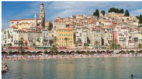
Menton od moře

Vysoká úroveň hry, ještě vyšší vklady, slavní hráči z celého světa na každém kroku, káva Lavazza a především nepředstavitelná vedra. Do jsou hlavní rysy letošního Otevřeného Mistrovství Evropy ve francouzském Mentonu, kterého se účastnilo přes 2 tisíce hráčů z 41 evropských a 13 mimoevropských zemí.