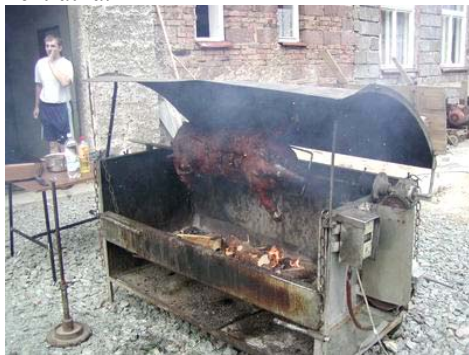
Čuník už se připravuje

Tradičně, letos už po dvacáté, se konal v sobotu před první srpnovou nedělí Ošerovský tref. Název je sice již trochu zavádějící, protože se konal v Hospodě u Škaldů ve Vrchovinách u Nového Města nad Metují, ale atmosféra, pro kterou je vyhledáván pozvanými hosty, se změnou místa konání neztratila.