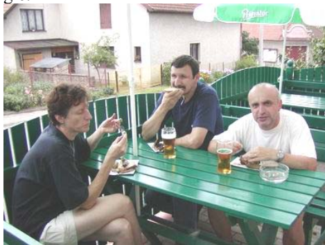
Jedna z častých přestávek na jídlo

O stravování nikdo mít strach nemusel, a jak je vidět z fotografií, mezi jednotlivými koly byly časté přestávky na doplnění energie.