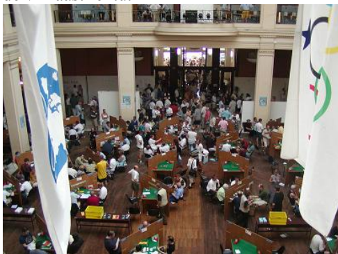
Pohled do hlavní hrací místnosti