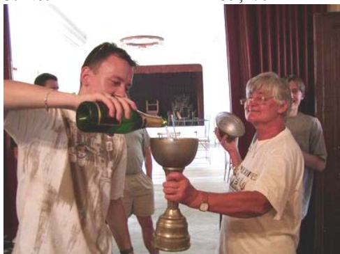
Vítěz hlavní soutěže s prezidentem Novoměstského klubu