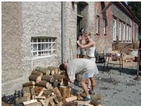
Udělal snad nějakou chybu v sehrávce?

Samozřejmě, že v losovaném páráku záleží mnoho na tom, jak dobrého a především příjemného partnera si vylosujete. Ti co měli drsnějšího partnera se vystavovali nebezpečí různých postihů.