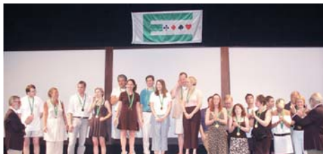
Vítězové mixových týmů