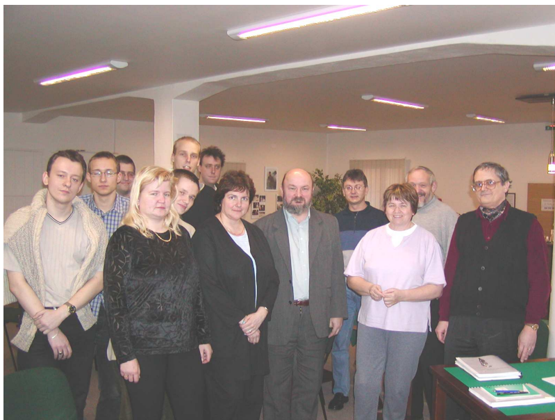
Účastníci školení reprezentantů