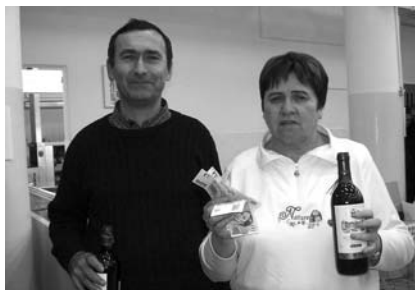
Vítězové VC Kralup