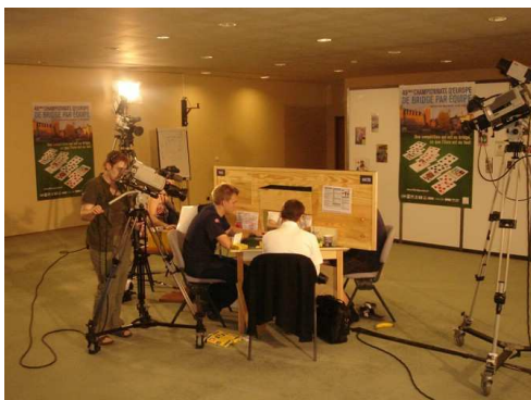
Hrací místnost bridžorámy

Mnoho zápasů bylo letos promítáno v přímých přenosech v bridžorámě a na internetových serverech BBO a Swan.