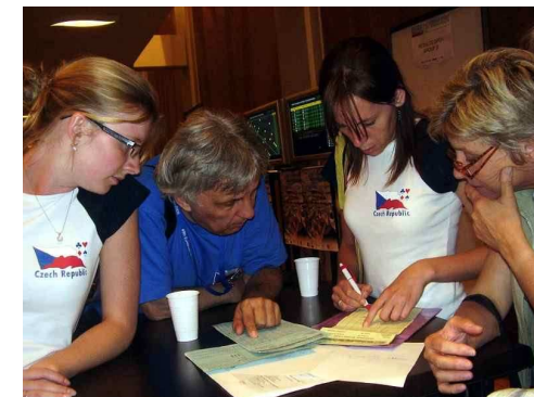
Naše ženy počítají výsledky

V seniorech zvítězili Turci před Švédy a Belgií. Čtvrté místo seniorů Polska je jejich jediným postupovým místem na Bermuda Bowl. České seniorské družstvo se letos mistrovství nezúčastnilo.