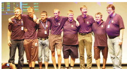
Mistři Evropy 2008 – Norové