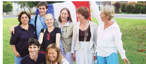
Mistryně Evropy 2008 – Francie

V ženách zvítězily favorizované Francouzky. Naše družstvo skončilo na 15. místě z 25 účastnic a nepomohla ani návštěva slavného poutního místa v Lurdech. Na postup do Bermuda Bowl s první šesticí by bylo třeba o 65 VP více.