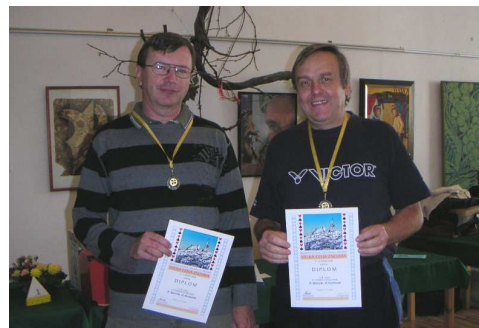
Bahník – Svoboda