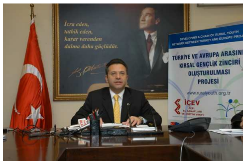
Guvernér oblasti Mersin v zaměstnání

Guvernér ostatně nebyl jen pasivním účastníkem předávání cen, ale aktivně si zahrál jeden večerní turnaj pod dohledem osobních strážců a osobních číšníků, kteří mu nosili jeho oblíbený čaj.