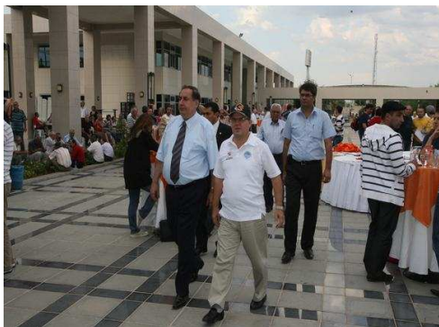
Příchod primátora s doprovodem

Guvernér ostatně nebyl jen pasivním účastníkem předávání cen, ale aktivně si zahrál jeden večerní turnaj pod dohledem osobních strážců a osobních číšníků, kteří mu nosili jeho oblíbený čaj.