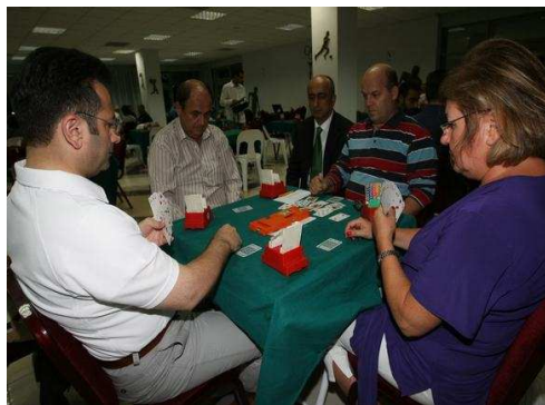
Guvernér oblasti Mersin v akci