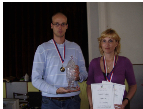
Vítězové Velké ceny

Ve dvoukolovém hlavním párovém turnaji bojovalo 32 dvojic.