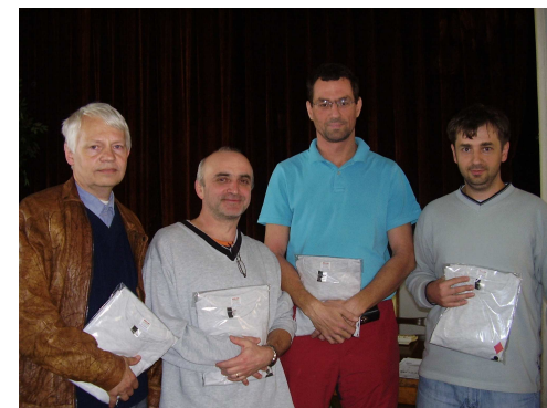
Vítězné družstvo domácích

Závěrečné nedělní soutěže týmů se zúčastnilo 11 družstev.