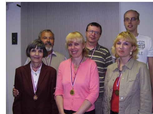
Medailisté přeboru mixů

Toto rozdání bych nazval dámský gambit, neboť se u našeho stolu nesmiřitelně střetla hráčka na Jihu s hráčkou na Západě.