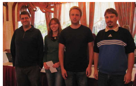
4. místo v týmech