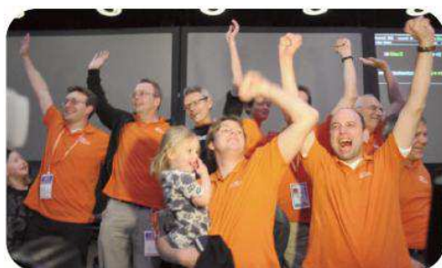
Radující se mistři světa

V boji o třetí místo si snadno poradila Itálie s USA1 169:69.