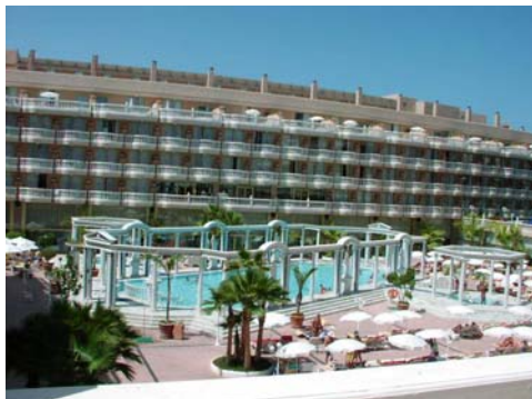
Hotel s hrací místností