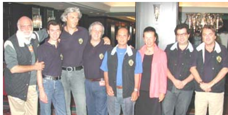
Vítězné Open týmů