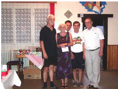
Vítězové soutěže týmů

Po pomalém začátku v Precisionu nabrala licitace obrátky. Je vidět, že nejen počítače rozdávají divoce. Samozřejmě =, což je v druhé v komerci obzvláště potěšující.