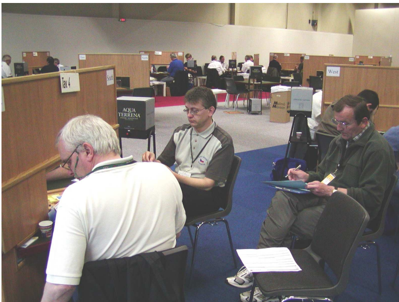
Zápas proti Islandu