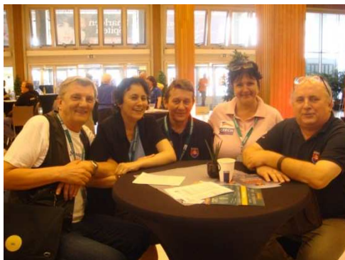
Slováci (a Češky) po posledním zápase

Slovensko nakonec skončilo na 15. z 19 družstev ve skupině, ale většinu soutěže se drželo kolem středu tabulky. Řekl bych, že pokud se tým podaří doplnit o dobrou třetí dvojici, může na dalších mistrovstvích rozhodovat i o více, než o tom, koho pustí do finále a koho ne.